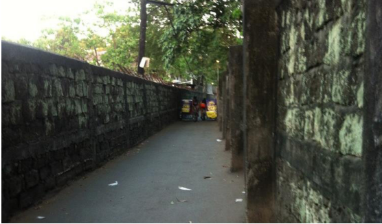
Larawan 11: Magkasalubong na pedicab

dahil uuwi ang mga pasahero “upang magluto”. Ang nagbibigay na pedicab ang siyang didikit sa pader, bahagyang tatagilid, at hihinto. Magtutuluy-tuloy naman ang pinagbibigyan.