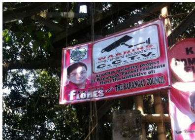
Larawan 6: Pabatid na may CCTV sa dulo ng eskinita

Gayunpaman, para sa pamunuan ng barangay, hindi sapat ang relihiyosong imahen kaya naglagay sila ng closed-circuit television (CCTV) sa itaas ng grotto. Minaksimisa ng barangay ang paggamit ng teknolohiya upang mapangalagaan ang kaligtasan sa pathway.