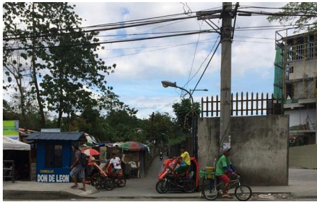
Larawan 10: Ang P. Bautista St. at ang katabing konstruksiyon ng Ayala Land Inc.