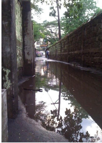
Larawan 8: Baha sa eskinita

ang tubig tuwing umuulan. Ikinatatakot ng mga residente ang ganitong sitwasyon dahil dumadalas ang mga nakakakita ng “ahas na lumalangoy galing sa bakanteng lote ng UPIS.” Sumasakay sa padyak ang may ekstrang badyet para sa pamasahe at lumulusong sa baha ang wala.