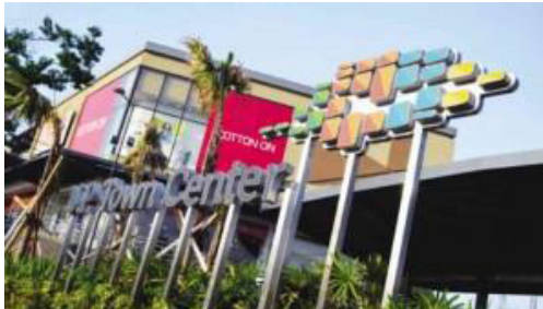
Larawan 14: UPTC sa Katipunan Road

Kahit sabihin ng ALI na “what we do is make UP Town Center an extension of the UP campuses” (Pastor 2014) pook na ito ng negosyo at hindi ng edukasyon. Hindi na masisilayan ng mga dating mag-aaral ng UPIS ang lugar kung saan sila natuto at umunlad bilang kabataan. Lunan din ng kontradiksiyon ang UPTC para sa miyembro ng akademikong pamayanan. Para sa mga administrador ng unibersidad, pagmumulan ng karagdagang kita ang renta ng ALI kaya kailangang palitan ng mga gusali ng negosyo ang dating UPIS. Subalit para sa ibang kasapi ng komunidad ng UP, pagpapahina ito sa paggigiit sa pamahalaan na bigyan ng sapat na subsidyo ang State Colleges and Universities (SUCs). Sa pamamagitan ng komersiyalisasyon ng mga ari-arian ng pamantasan katulad ng lupa, tumataas ang posibilidad na aasa na lamang ang gobyerno sa “kakayanan” ng mga SUC na makalikha ng sariling pondo kaysa tupdin ang tungkulin nito sa sektor ng edukasyon.