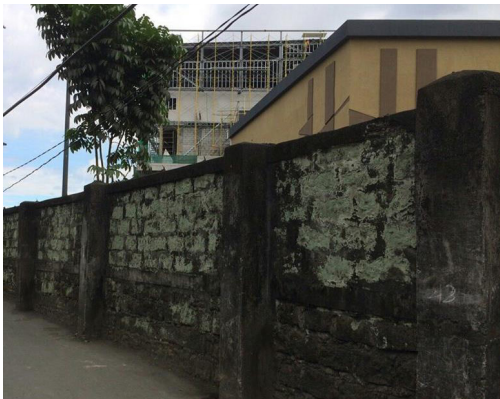
Larawan 4: Itinatayong gusali ng UPTC sa dating bakanteng lote ng UP

umaga at hapon sa buong taon. Matatagpuan dito ang malawak na mga bukirin. Naging bahagi ng Lungsod Quezon ang sityo Pansol noong Oktubre 12, 1939 sa pamamagitan ng Commonwealth Act No. 502 (qcpublishlibrary.org). Ang P. Bautista St. naman ay dating Kalye Montalban na ipinangalan sa dating kapitan na si Procopio Bautista na nanungkulan noong dekada '60. Kilala ito bilang “pathway” sa mga drayber ng pedicab at residente sa lugar, “Great Wall of Pansol” para sa mga mag-aaral na hayskul sa UP Integrated School (UPIS), at simpleng “eskinita” para sa mga dayo sa barangay. Humigit-kumulang 60 metro ang haba ng daan at 2 metro ang lapad na napapagitnaan ng kongkretong pader ng NAWASA/MWSS at dating bakanteng lote ng UPIS bago naipatayo ng Ayala Land Inc. (ALI) ang UP Town Center (UPTC). Nanalo ang ALI sa bidding para sa komersiyal na kompleks sa 7.4 ektaryang kinatitirikan ng UPIS sa ilalim ng 25 taong kontrata ng pag-upa sa lugar (dayritproperties.com).