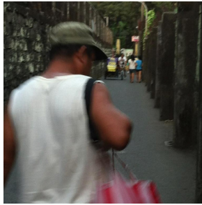
Larawan 2: Masikip na espasyo