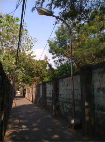
Larawan 3: Sa kaliwang bahagi ang NAWASA/ MWSS at sa kanang bahagi ang bakanteng lupa ng UP bago paupahan sa Ayala Land Inc.

pagkakataong nagkakairingan ang mga naglalakad o nakasakay na gumagamit dito. Tumitingkad ang nasabing usapin kung walang ibang lugar na mapuntahan bunga ng mga kongkretong harang. Upang itakda ang hangganan ng lupa ng NAWASA (dating pangalan ng Metropolitan Waterworks and Sewerage System o MWSS) at Unibersidad ng Pilipinas Diliman (UP), pinaderan ang magkabilang panig na nagdulot ng pagkakaput ng mga dumadaan.