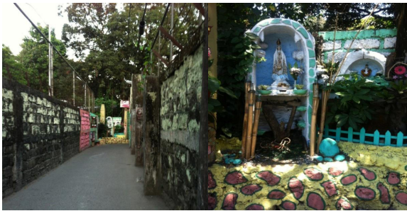
Larawan 5: Grotto sa dulo ng eskinita

Upang maiwasto ang negatibong pagtingin mahalagang mapanatiling malinis at maganda ang lugar kaya inayos ang dulong bahagi ng eskinita. Simboliko ang pagkakaroon ng pook-dasalan sa dulo ng pathway upang ipakita, lalo na sa mga dayo, na bagama’t may masikip silang espasyo, hindi nangangahulugang kriminal ang mga tao rito.