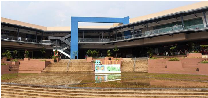
Larawan 13: Maluwang na espasyo sa gitnang bahagi ng UPTC