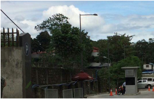
Larawan 12: Nasa kaliwang bahagi ang Great Wall of Pansol

Nagsimula ang konstruksiyon ng mall sa dating kinalalagyan ng hayskul ng UPIS noong 2012 at batay sa website ng UPTC, “Phase 1A, which primarily consists of restaurants and retail stores, is now open. Phase 1B and Phase 2 will open within the next two years” (ayalamalls.com.ph). Ang nasa Larawan 12 ay ang loteng katabi ng eskinita na nababakuran ng Great Wall of Pansol. Bagaman hindi pa tapos, ito ang nagsisilbing entrada para sa parking ng mga kliyente ng mall. Humigit-kumulang dalawampung metro ang lapad nito at maluwang ang espasyo kahit magkasabay na pumasok at lumabas ang dalawang sasakyan.