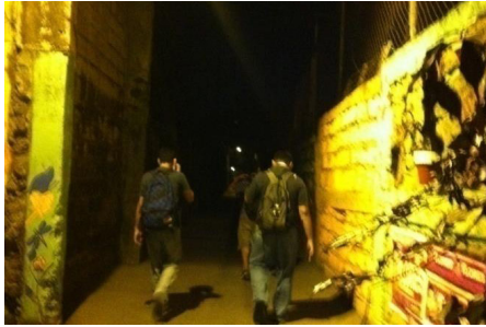
Larawan 9: Eskinita sa gabi

regular na nagpapadyak. Umieksira sila sa panahong tapos na ang gawain sa bahay at kung may maliliit na anak, inaangkas nila ito sa biyahe. Subalit naukuwentong hindi sila pinapayagan ng asawa kung sira ang mga ilaw sa eskinita. Disbentahe sa kababaihan ang madilim na kalye dahil dito madalas na nagaganap ang krimen sa kanila (Hubbard 115). Maski ang ekspresyon na “dapat alam ng babae kung saan lulugar” ay paglalarawan sa usapin ng kasarian sa espasyo (Hayden 1997). Patunay lamang itong limitado pa rin ang ginagalawan ng kababaihan at ang madilim na eskinita ay hindi para sa kanila.